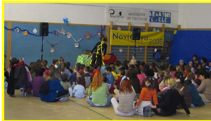
Tronca y Cuentacuentos